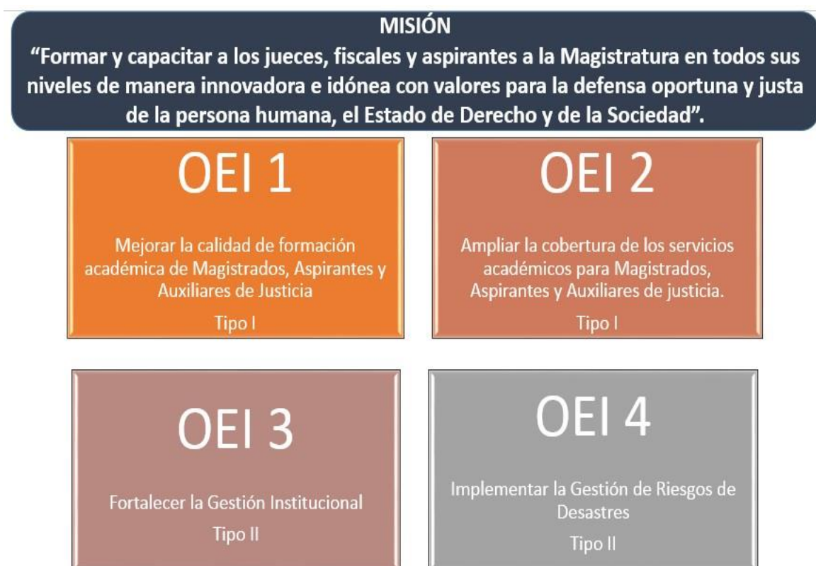
CUADRO Nº 3: OBJETIVOS ESTRATEGICOS INSTITUCIONALES (OEI)

Es importante considerar que los Objetivos Estratégicos Institucionales se clasifican en tipo I y Tipo II. El OEI de Tipo I se refiere a la población beneficiaria a la cual sirve la Academia de la Magistratura y cuyas condiciones se buscan mejorar con la entrega de nuestros servicios. Por otro lado, tenemos el OEI de Tipo II, se refiere a las condiciones internas que la entidad busca fortalecer, para mejorar sus procesos de soporte o su diseño organizacional con el objeto de optimizar el uso de nuestros recursos y así, atender adecuadamente a la población objetivo y brindar un servicio de alta calidad.