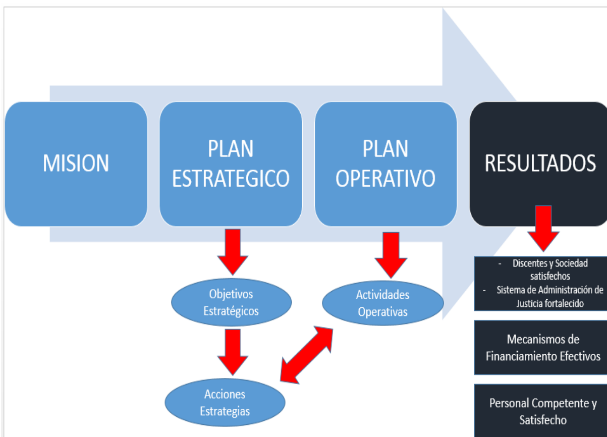
GRAFICO 1: MARCO ESTRATEGICO INSTITUCIONAL

este punto donde el Plan Operativo Institucional del 2021 establece y define las actividades operativas necesarias e indispensables que nos permitirán ejecutar las acciones estratégicas y por ende el cumplimiento de los objetivos estratégicos; todo esto con la finalidad de obtener resultados que brinden valor público a la sociedad, con discentes satisfechos por los servicios de capacitación brindados y un Sistema de Administración de Justicia fortalecido, permitiendo a la vez, una adecuada gestión de recursos, con mecanismos de financiamiento efectivos y con un personal que labore de manera eficiente y con un alto grado de satisfacción.