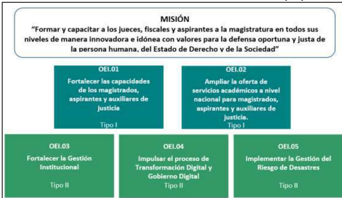
CUADRO Nº 1: OBJETIVOS ESTRATEGICOS INSTITUCIONALES (OEI)

Estos Objetivos Estratégicos Institucionales se clasifican en tipo I y Tipo II. Los OEI de Tipo I se refieren a la población beneficiaria (magistrados) a la cual sirve la Academia de la Magistratura y cuyas condiciones se buscan mejorar con la entrega de nuestros servicios de capacitación. Por otro lado, tenemos los OEI de Tipo II, que se refieren a las condiciones internas que la entidad busca fortalecer, para mejorar sus procesos de soporte o su diseño organizacional con el objeto de optimizar el uso de los recursos y así, atender adecuadamente a la población objetivo y brindar un servicio de alta calidad.